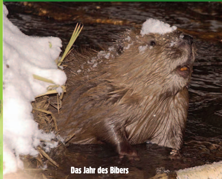
Das Jahr des Bibers

Biber sind dämmerungs- und nachtaktiv. Wann sie abends aus ihrer Burg auftauchen, ist von Revier zu Revier unterschiedlich und schwankt auch jahreszeitlich. In ungestörten Revieren können Biber auch am Tage beobachtet werden, in störungsintensiven Revieren tauchen sie oft erst bei völliger Dunkelheit auf. Die Nacht verbringen die Tiere mit Nahrungsaufnahme, Revierkontrolle und Markierung, Bauen und Ausbessern der Burgen und Dämme und mit dem Familienleben. Am frühen Morgen tauchen sie wieder in den Bau ein und verbringen den Tag meist mit (gegenseitiger) Körperpflege, Fressen und Schlafen.