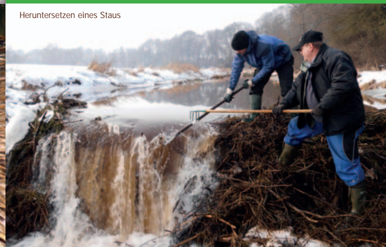
Heruntersetzen eines Staus