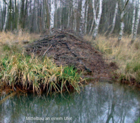
Mittelbau an einem Ufer

Zusätzlich gräbt der Biber im Revier verteilte einfache, mehr oder weniger lange Röhren, die unterschiedlichen Zwecken dienen: sie können bei Gefahr als Fluchröhren zum Abtauchen dienen, unterirdisch zwei nebeneinander liegende Gewässer verbinden oder „versteckte“ Ausstiege in Nahrungsflächen sein.