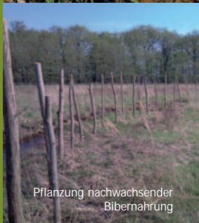
Zwergkopfwiede als nachwachsende Biber-nahrung