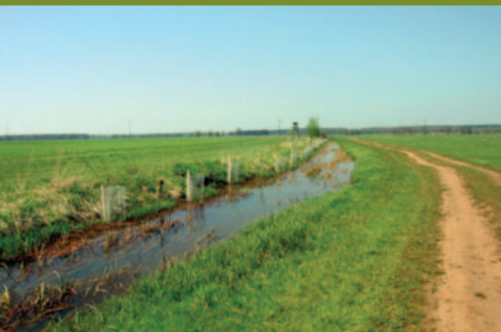
Kulturlandschaft in der Mulde