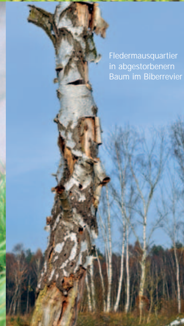
Fledermausquartier in abgestorbenem Baum im Biberrevier